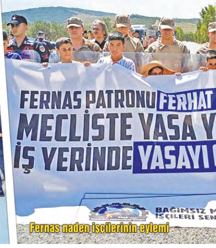
Fernas maden işçilerinin eylemi