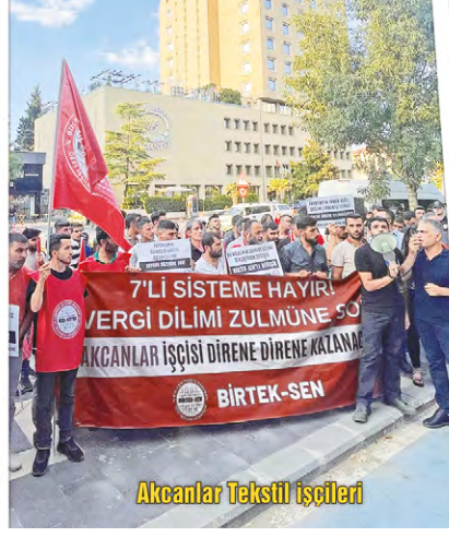
Akcanlar Tekstil işçileri