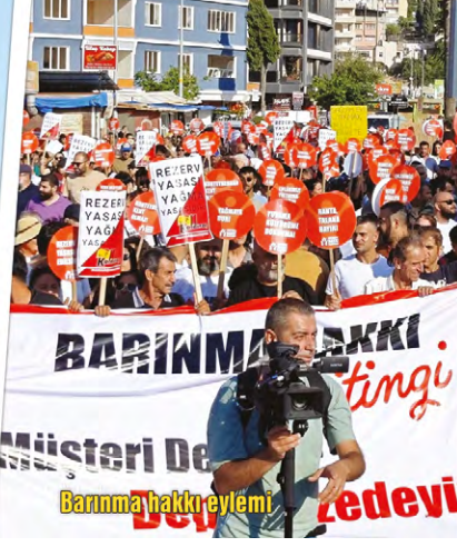
Barınma hakkı eylemi