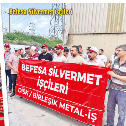
Befesa Silvermet işçileri