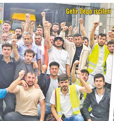
Getir Depo işçileri

İzmir'de Tekgıda-İş Sendikasının örgütlü olduğu Kristal Yağ grevi kazanımla sonuçlandı. İstanbul/Tuzla'da Selüloz-İş Sendikasının örgütlü olduğu MKB Rondo'da ve Öz Büro-İş Sendikasının örgütlü olduğu Sarar Ankara Ankamall mağazasında işçiler greve çıktı. ■