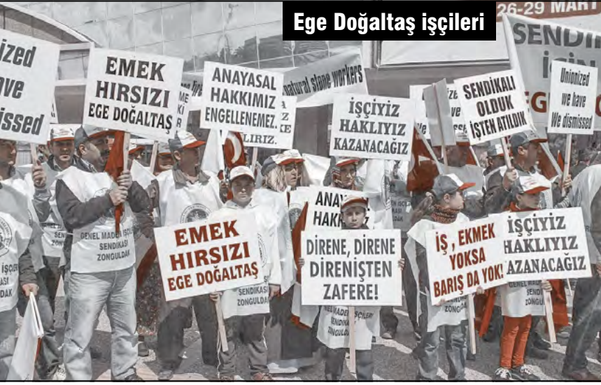
Ege Doğaltaş işçileri

vam edecektir. Birlikte üretmek istiyoruz. Biz evimize ekmek götürmek istiyoruz. Başlattığımız yasal süreç de devam ediyor. Mücadelemiz inançlı ve kararlı bir şekilde zafere ulaşana kadar devam edecektir” dedi.