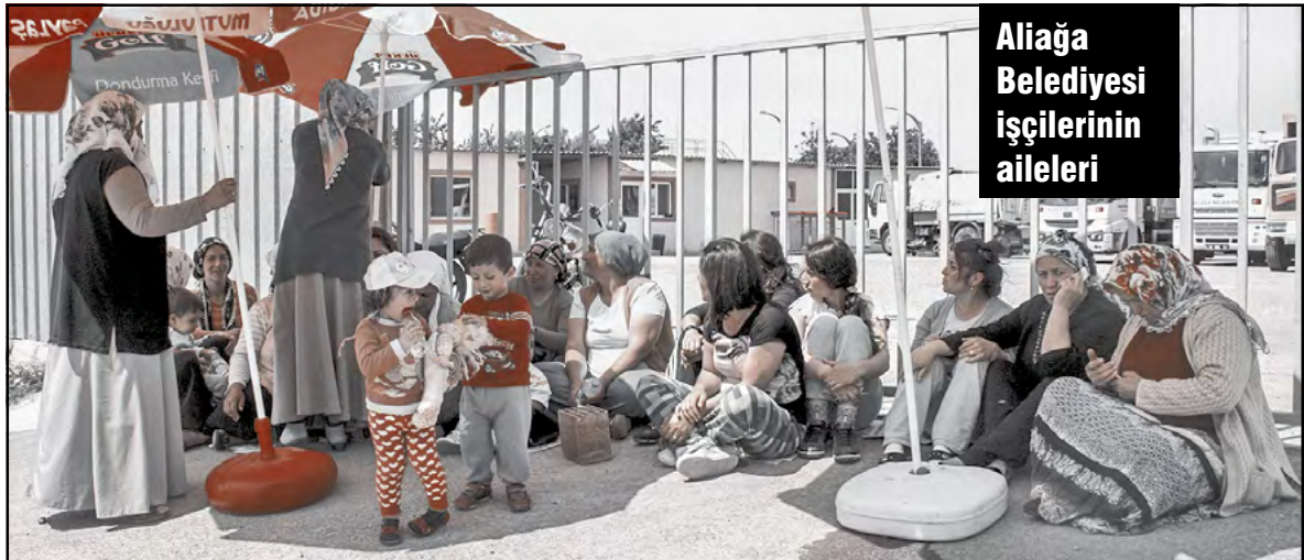
Aliağa Belediyesi işçilerinin aileleri